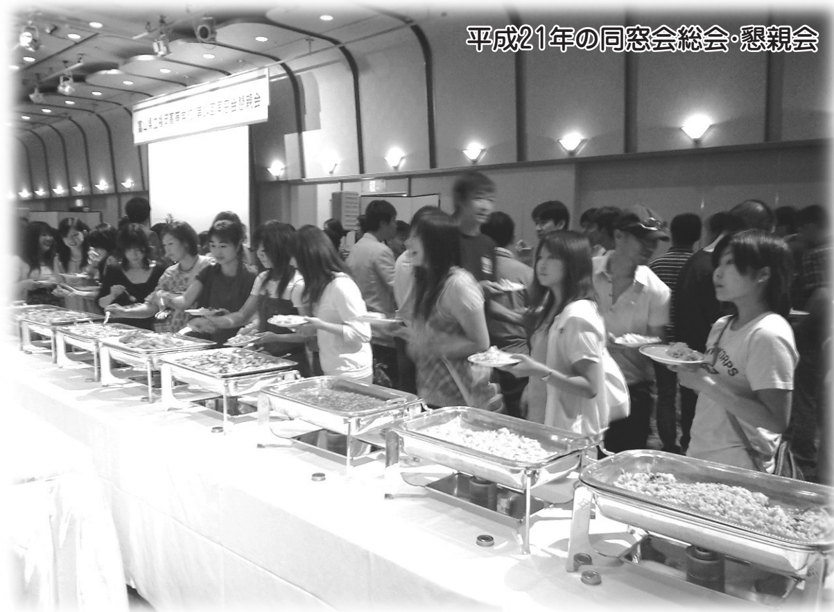
平成21年の同窓会総会・懇親会

事務局:〒939-0127 富山県高岡市福岡町上蓑561番地 福岡高等学校内 ホームページ URL http://www.fukuoka-h.tym.ed.jp/ja/doso.html