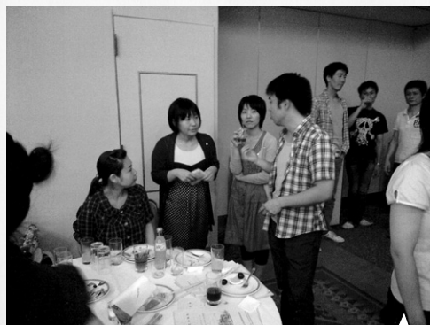
10年ぶりの再会に 盛り上がりました。(14回生)