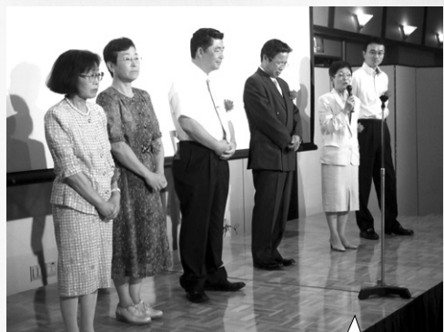
3回生、4回生、15回生の 恩師の先生方