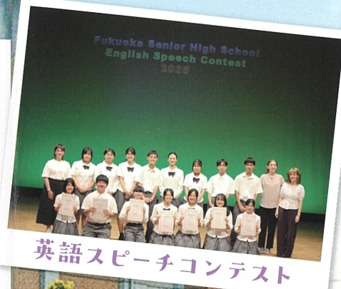
英語スピーチコンテスト