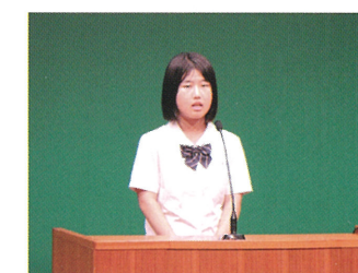
(スピーチコンテスト)