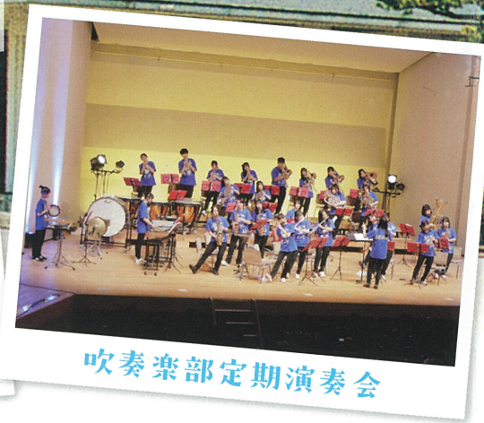
吹奏楽部定期演奏会