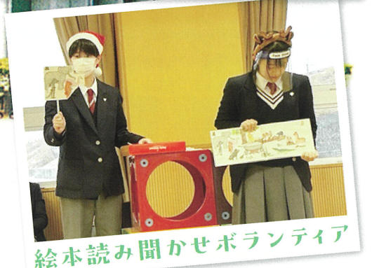
絵本読み聞かせボランティア