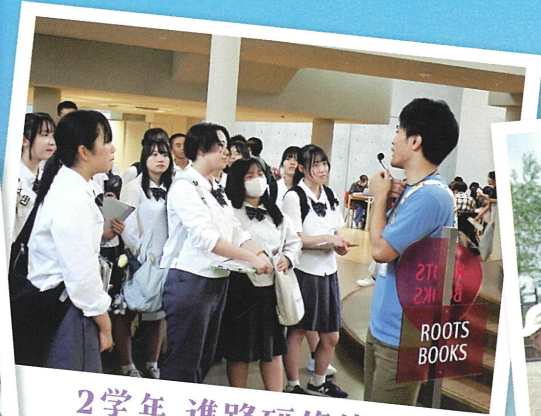
2学年 進路研修旅行