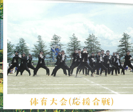
体育大会(応援合戦)