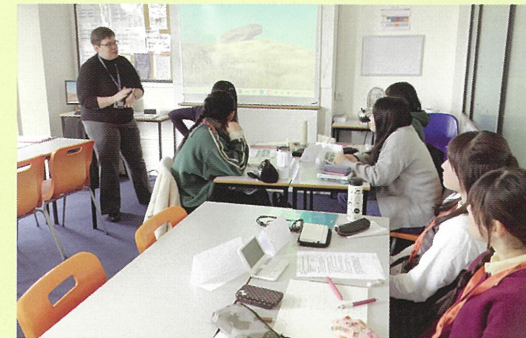
語学学校での授業風景

2026年3月に、20名の生徒が、語学研修のため英国を訪れました。期間は、10日間。ワーキングの語学学校に通い、午前は英語の授業を受け、午後は近郊の歴史的建造物を訪問したり、現地の高校で訪問交流したりし、イギリスの歴史と文化に触れました。