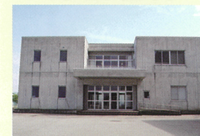
セミナーハウス「朋友館」