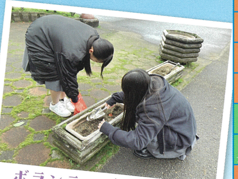
ボランティア(花壇整備)