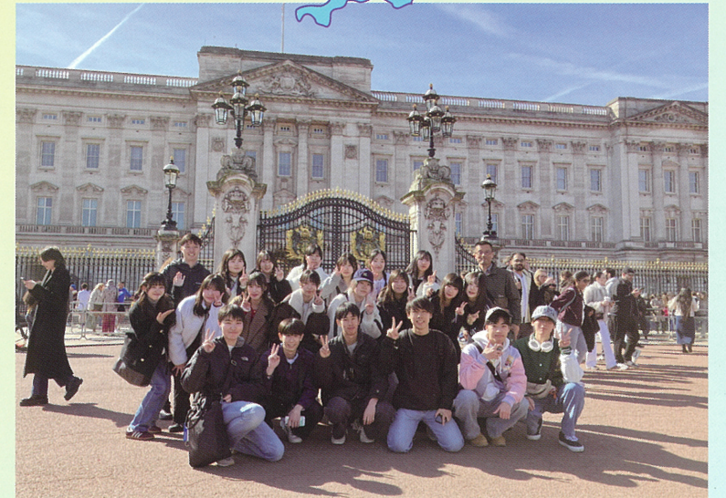
バッキンガム宮殿にて

英国語学研修を通して、英語を使って人と接する楽しさと、難しさを実感しました。また、異国の文化や価値観に触れることで、国際的な視野を広めることができました。